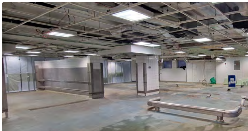
Raum für Neues : In der Halle der ehemaligen Spülküche werden moderne Spülstraßen installiert.

Auch wenn diese Übergangslösung nicht in jeder Hinsicht ideal ist, sichert sie während der Modernisierungsphase die zuverlässige und hygienisch einwandfreie Versorgung. Und sie ebnet den Weg dazu, was nach dem Umbau wieder Normalität wird: Eine reibungslose Speisenausgabe mit altbekanntem Geschirr, unterstützt durch neue, effiziente Spülstraßen, die langfristig wieder unsere Ressourcen schonen und den Alltag für unsere Kolleginnen und Kollegen deutlich erleichtern.