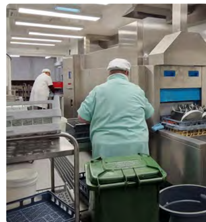
Zwei unserer Kollegen/innen bei ihrer Arbeit im vergleichsweise engen Raum und kleinen Straßen.